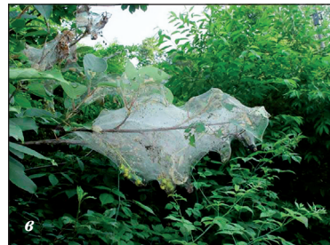
Рис. 5. Американський білий метелик: a — імаго; б, в — пошкодження рослин личинками