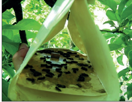
Рис. 1. Феромонна пастка

Для виявлення шкідників підготовлені пастки типу Атракон А розмішують на деревах на висоті 1,5—2,0 м у периферійній частині західного боку крони (рис. 1). Починають розмішувати пастки за встановлення середньодобової температури не нижче +13°C, тобто наприкінці квітня — до закінчення вересня. Схема розміщення на ділянці або в кварталах саду — рівномірно човниковим способом, на відстані одна від одної 100—150 м, з