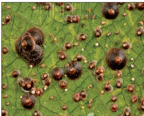
Рис. 3. Каліфорнійська щитівка