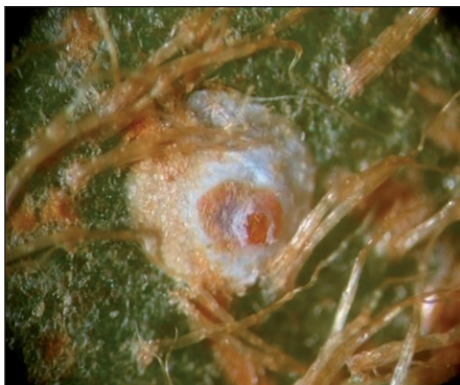
Рис. 4. Тутова щитівка

дах. Визначають ділянки, де шкідника було виявлено раніше. Пастки розміщують на межі цих ділянок на відстані до 1 км від них. При цьому на обстежуваній ділянці одну пастку розміщують поблизу межі саду, іншу — всередині. Якщо пасток достатньо, їх розміщують поблизу межі саду з різних боків на відстані одна від одної не менше 100 м. Цю роботу продовжують до середини жовтня. Оглядають та вибирають із них метеликів щотижня [3, 14].