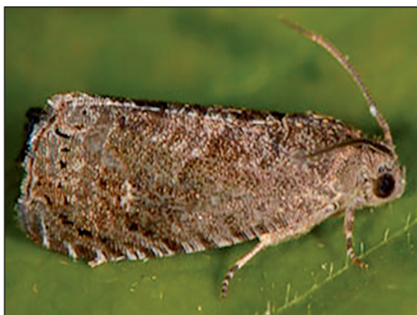
Рис. 2. Східна плодожерка