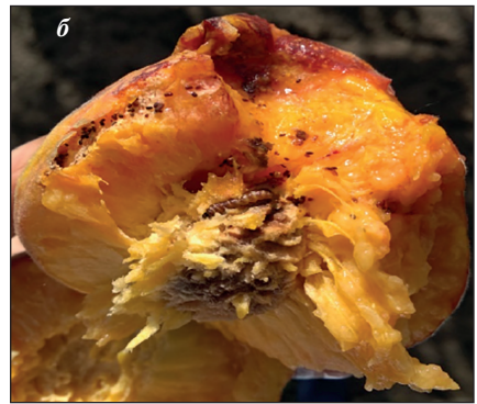
Рис. 7. Пошкоджений плід персика гусеницями східної плодожерки (а) і фруктової смугастої молі (б)