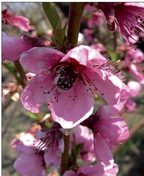
Рис. 1. Імаго оленки волохатої

лівішим фітофагом була оленка волохата ( Epicometis hirta Poda.) (рис. 1). Слід зауважити, що в окремі роки в період цвітіння дерев персика фіксується посилення шкідливості даного виду внаслідок масових міграцій жуків в сади з прилеглих територій. Рівень заселення дерев імагом шкідника у 2018 р. становив 0,3–2,1 екз./100 квіток залежно від сорту (рис. 2), при цьому пошкодженість квіток не перевищувала 4,5%. Наступного року чисельність фітофага підвищилась на всіх сортах, зокрема на пізньостиглому сорті Мрія досягала 5,8 екз./100 квіток. Щільність популяції імаго оленки волохатої на інших сортах становила 3,0–4,8 екз./100 квіток.