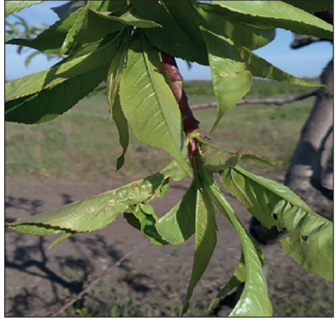
Рис. 6. Пошкодження листків персика листокруткою

За даними спостережень у насадженнях персика після цвітіння спостерігалося два види листокруток: розанова ( Archips rosana L.) та всеїдна ( Archips podana Scop.) (рис. 6). У 2018 р. на більшості сортів персика розанової листокрутки не виявляли взагалі, а наступного року сорти були слабо заселені фітофагом — від 0,4 до 1,3 екз./дереву (ЕПШ — 6,0 гусениць/дереву). Інший вид листокрутки також виявився малочисельним — до 0,5 екз./дереву.