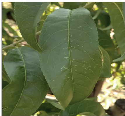
Рис. 5. Пошкодження листків персика цикадкою розановою

В агроценозі персика спостерігався комплекс сисних шкідників: глодовий ( Tetranychus viennensis Zacher) та звичайний павутинний ( Tetranychus urticae Koch.) кліщі, а також трипс розановий ( Thrips fuscipennis Haliche) і цикадка розанова (рис. 5) ( Typhlocyba rosae L.). Встановлено, що у 2018 р. на всіх сортах персика зафіксовано слабку заселеність листків рухомими стадіями глодового кліща ( Tetranychus viennensis Zacher) — до 0,8 екз./листок. Наступного року під впливом погодних умов рівень заселення видом підвищився на більшості сортів, зокрема ранньостиглих Мелітопольський ясний та Чарівник у 3,4—4,2 раза (табл. 1). Проте така чисельність глодового кліща не досягала порогового рівня шкідливості.