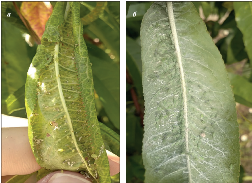
Рис. 3. Заселеність листків персика зеленою персиковою попелицею (а) та сливовою обпиленою попелицею (б) (фото Юдицької І.В.)

Протягом літнього періоду 2018 р. не фіксували розмноження попелиць, а у 2019 р. поодинокі невеликі колонії зеленої персикової попелиці ( Myzodes persicae Sulz.) (рис. 3 а) на рівні 0,8—1,0 бал спостерігали на сортах Мелітопольський ясний, Чарівник, Спокуса, Мрія (рис. 4). На інших досліджуваних сортах персика зафіксовано середній рівень заселення пагонів і листків попелицею — у межах 1,4—1,9 бала. Щільність популяції сливової обпиленої попелиці ( Hyalopterus pruni Geoffr.) (рис. 3 б) була у межах 0,4—0,8 бала та залежно від сорту суттєво не відрізнялася.