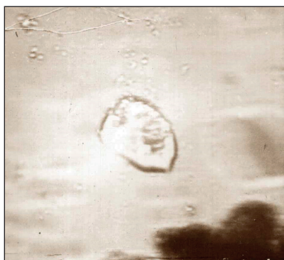
Рис. 4. Вплив хімічних препаратів на зооспорангії збудника раку Synchytrium endobioticum (Schilbersky) Percival (240×)