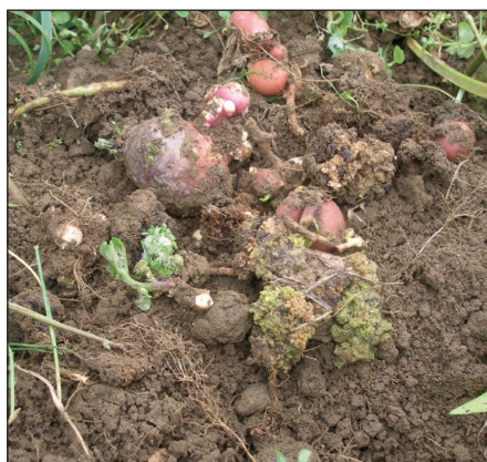
Рис. 5. Сорт картоплі Поліська рожева, уражений збудником раку