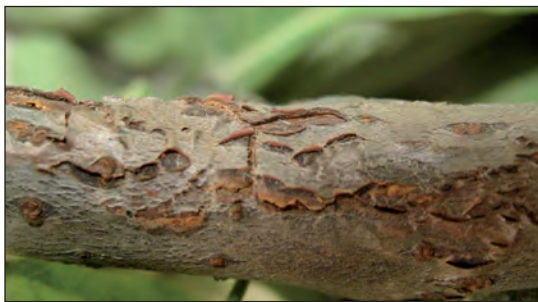
Рис. 2. Утворення виразок на корі стовбура яблуні

Найінтенсивніший розвиток бактеріального некрозу відбувався навесні, оскільки збудник хвороби невибагливий до температурних умов. До того ж дерева більш сприйнятливі до пошкоджень кори в період інтенсивного сокоруху. Влітку спостерігалось ураження лише окремих пагонів (до 5% від обсягу крони), які швидко всихали, та кореневої порослі в насадженнях, де в якості підщепи використовували