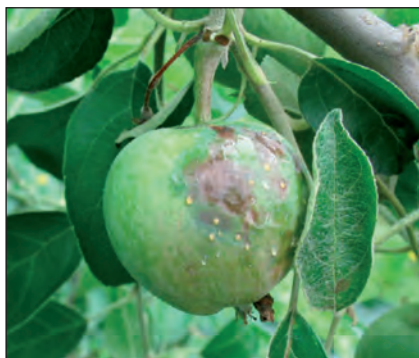
Рис. 3. Ураження недостиглих плодів яблуні бактеріальним опіком з утворенням ексудату

хворобою досягав 55% обсягу крони. У ФГ «Тарас» розповсюдження збудника хвороби стало наслідком обрізування дерев, рівень ураження крони груші різних сортів становив 30—50%, яблуні — до 15%.