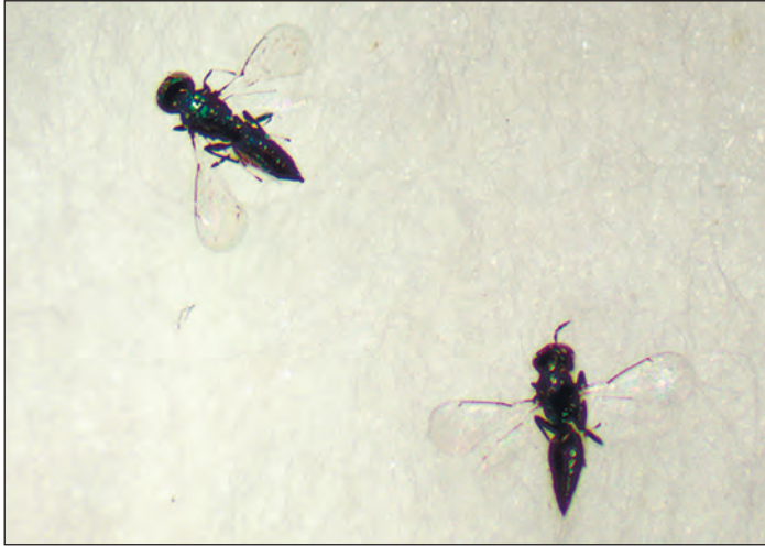
Рис. 6. Pedioobius saulius W.