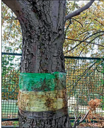
Рис. 2. Кольорова пастка в Національному ботанічному саду імені М.М. Гришка НАН України

Основними компонентами біологічного методу природної регуляції чисельності лускокрилих є родини Trichogrammatidae [42—44], Coccinellidae [9] та Chrysopidae, які здійснюють знищення або паразитування на стадії яйця [9]. Дослідження показали, що представники Trichogrammatidae, зокрема T. pintoï та T. evanescens , не паразитують на яйцях каштанової мінуючої молі [45]. Також відзначається, що