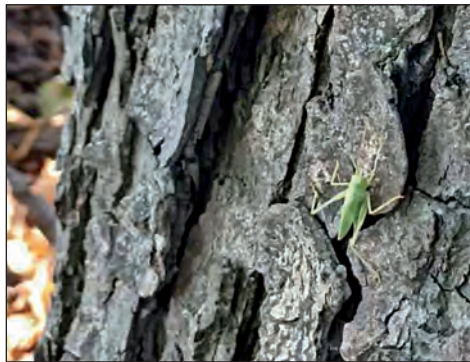
Рис. 5. Коник ( Meconeta thalassinum ) (фото М.М. Башенко, зроблено у Національному ботанічному саду імені М.М. Гришка НАН України, 2024 р.)

M. thalassinum часто спостерігається на нижніх ярусах гіркокаштана звичайного (рис. 5).