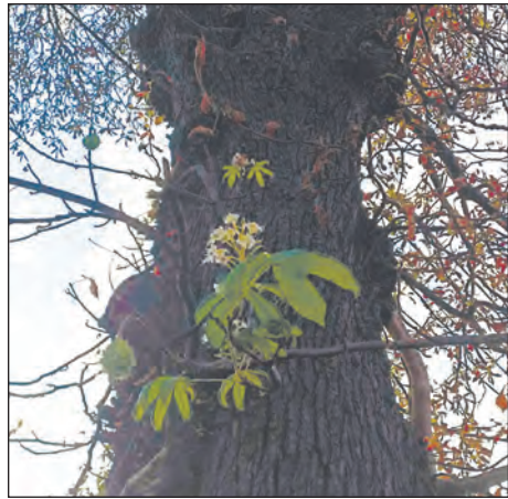
Рис. 1. Осіннє цвітіння каштана, м. Київ, Подільський район, 14.09.2023 р.

Внаслідок ушкоджень, завданих Cameria ohridella D., гіркокаштан звичайний ( Aesculus hippocastanum L.) втрачає не лише естетичну привабливість, а й зазнає значного зменшення фотосинтетичних процесів. Відсутність хлорофілу призводить до порудіння, висихання та опадання листя, що негативно впливає на фізіологічний стан деревини. У зв'язку з розвитком нових листків та повторним цвітінням у осінній період (рис. 1), гіркокаштан звичайний втрачає здатність забезпечити себе необхідними поживними речовинами, що призводить до часткового або повного вимерзання цих дерев під час заморозків [24]. Ушкодження листкових пластинок, спричинені шкідниками, є основною причиною ураження листків фітопатогенними грибами, такими як Guignardia aesculi (Peck) Stev., Pseudomonas syringae pv. Aesculi , Uncinula flexuosa , Erysiphe flexuosa , Coniothyrium australe , Diplodia aesculi , Dothiorella aesculi , Fusicoccum aesculi , Phoma hippocastani , Phomopsis conjugata , Aspergillus spp. [25–26].