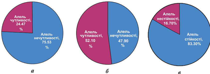
Рис. 1. Частоти сортів із різними алельними станами генів (а) Tsn1 (б) Tsc2 (в) TDF_076_2D у досліджених сортах пшениці ярої м'якої української селекції

Результати та обговорення. За допомогою маркерів fcp623 , XBE444541 та INDEL1 генів Tsn1 , Tsc2 та TDF_076_2D дослідили 94 сорти пшениці м'якої ярої (табл.). Частка сортів пшениці, у яких було визначено алель tr , відносно загальної кількості проаналізованих для ярої пшениці — 75,5%, або 71 сорт з 94 (рис. 1).